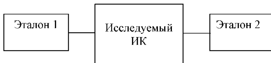
Рис. 5.1. Структурная схема поверки ИК

Рассмотрим случай, когда преобладают влияющие факторы, которые приводят к закономерному искажению результатов измерений, а стандартным отклонением (мерой неопределенности, оцениваемой по типу А) можно пренебречь. Структурная схема для выполнения поверки аналоговых и цифроаналоговых ИК приведена на рис.5.1.